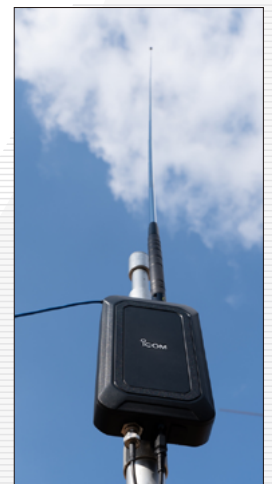
... und mit einer 50-Ω-Antenne.