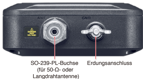
SO-239-PL-Buchse (für 50-Ω- oder Langdrahtantenne) Erdungsanschluss