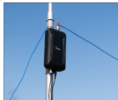
Installationsbeispiel mit einer Drahtantenne ...